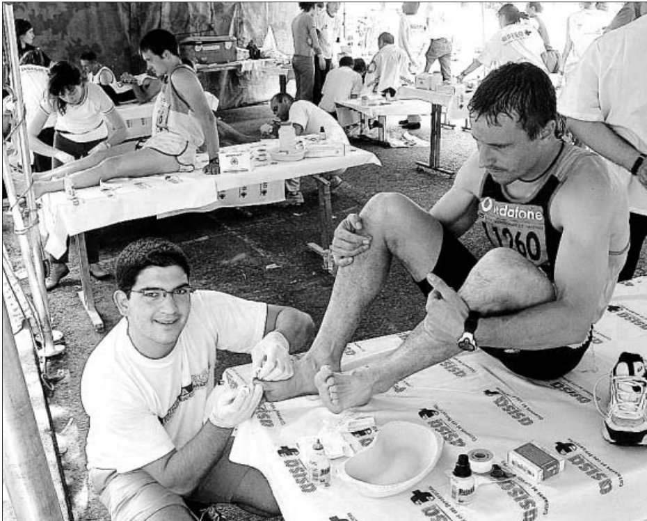
Un voluntario atiende a un corredor después de disputar una maratón.